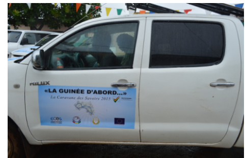
Autocollant sur les 5 voitures de la Caravane des Savoirs – La Guinée d'abord

Le plan de communication et de visibilité de Programme Pacte-Guinée I a été sans doute d'un grand impact dans plusieurs domaines, répondant à des activités et ou des communications en utilisant tous les moyens de diffusion, permettant ainsi d'atteindre un impact majeur.