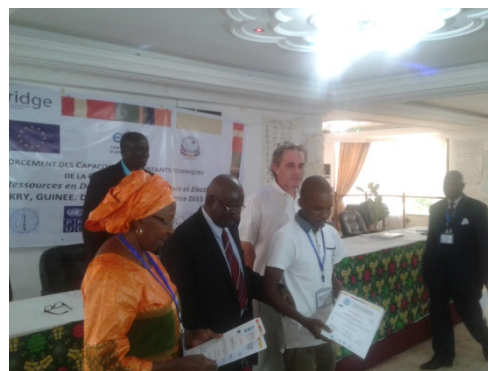
Formation BRIDGE, septembre 2015 à Conakry

La composante a été centrée, sur des formations utilisant la méthodologie BRIDGE, internationalement reconnue. Celle-ci répondait bien au besoin de développer les capacités de la CENI en matière d'application des standards internationaux pour s'engager à organiser des élections paisibles, transparentes et crédibles.