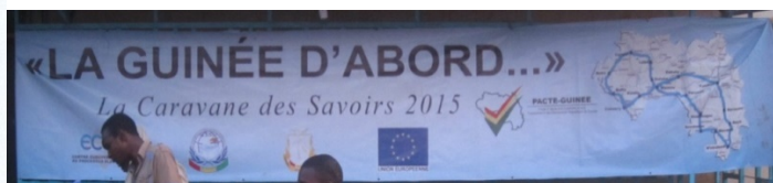
Bannière – La Caravane « La Guinée d'abord »