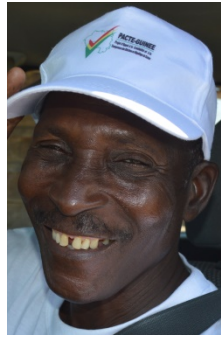
Casquette de la Caravane-La Guinée d'abord