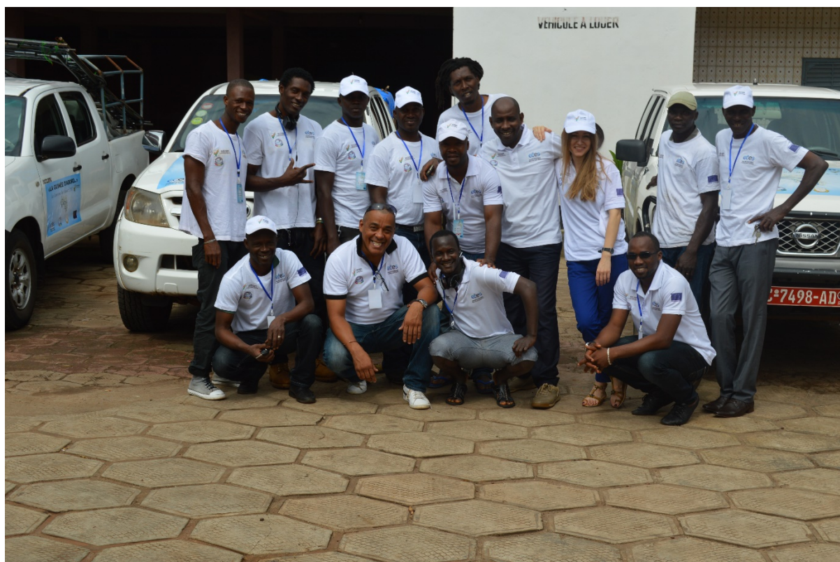
L'équipe de la Caravane des Savoirs – La Guinée d'abord

De plus affiner davantage les indicateurs de suivi des effets, notamment ceux concernant les taux de satisfaction sur le déroulement de la campagne électorale et sur le déroulement de la campagne d'enregistrement, en donnant suite et en renforçant l'action du Programme Pacte-Guinée I, des sondages au niveau de la population sur sa perception des enjeux démocratiques et sur son opinion par rapport aux acteurs politiques.