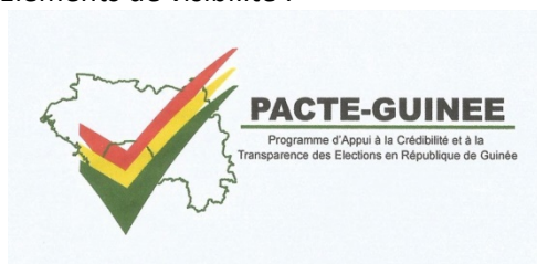
Logo du projet – Programme Pacte-Guinée I