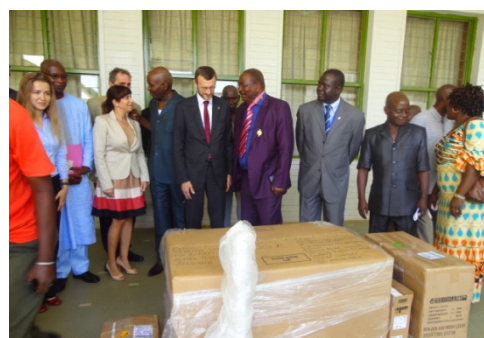
Remise d'un émetteur pour la radio parlementaire

L'appui du projet aux Nouvelles Institutions de la République a contribué à la création de la Radio parlementaire au sein de l'Assemblée Nationale, donnant lieu au résultat effectif qui a fait suite à l'appui et à l'accompagnement indiqué dans les deux PARCAN, et à l'heure actuelle espéré pour le PACTE II.