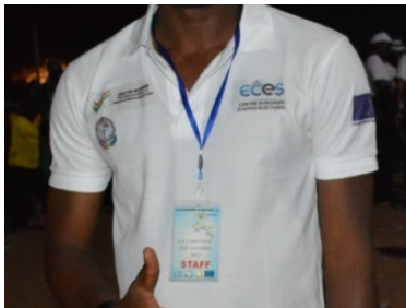
T-shirt de la Caravane des Savoirs – La Guinée d'abord