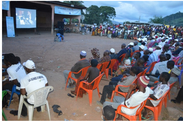
Projection du film "An African Election", Macenta, Octobre 2015