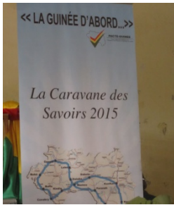
Bannière verticale de la Caravane